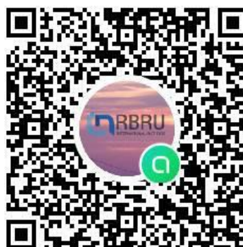
Line Open Chat นักศึกษาปี 62