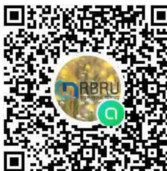
Line Open Chat นักศึกษาปี 64