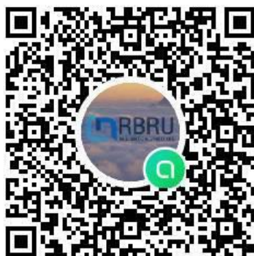
Line Open Chat นักศึกษาปี 63