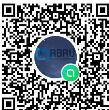
Line Open Chat นักศึกษาปี 60